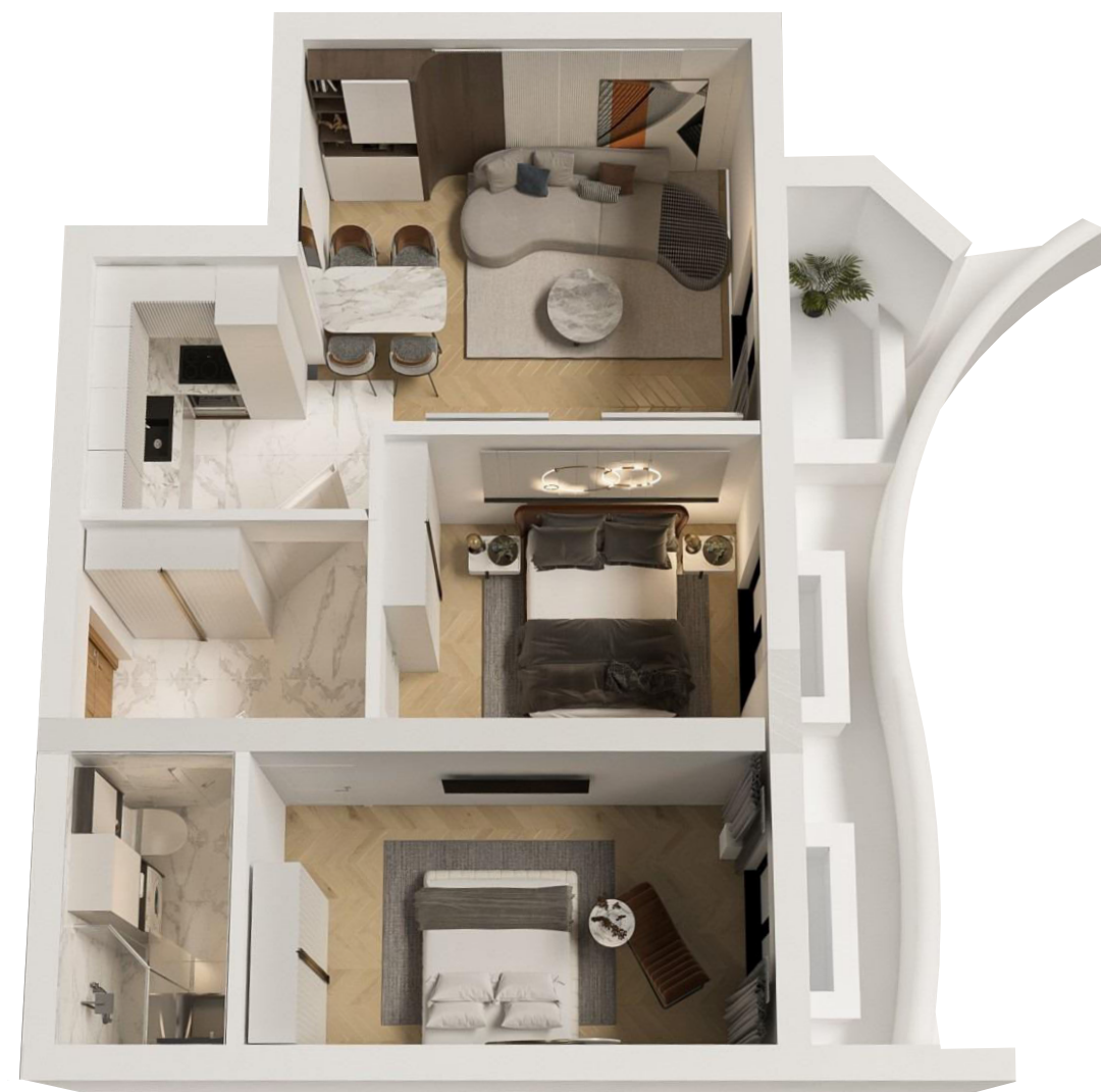
3D MODEL STANA